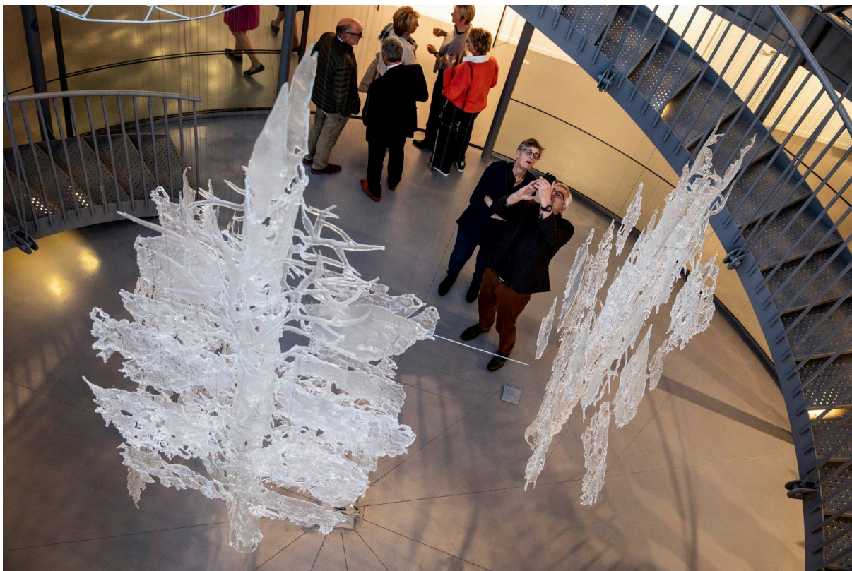
SE GLASS, Glazenhuis, Belgien 2019